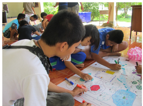
กลุ่มเยาวชนอนุรักษ์และฟื้นฟูป่าดอนหนองโจน 3

แต่ปัญหาที่พบ คือ ทำเรื่องป่าแต่ไม่มีความรู้เรื่องการจัดการป่า เด็กคิดวิเคราะห์ไม่ได้ ไม่กล้าพูด ไม่เคยแลกเปลี่ยนกับกลุ่มเยาวชนอื่น แนวทางการทำงานไม่ชัดเจน ไม่มีเป้าหมาย ไม่มีหลักการ จนกระทั่งได้ เข้ามาร่วมกับเครือข่ายต้นกล้าในป่าใหญ่ นี่จึงเป็นโอกาสที่จะทำให้ได้ พัฒนากลุ่มเยาวชน อีกทั้งเด็กๆก็ได้พัฒนาตัวเองด้วย